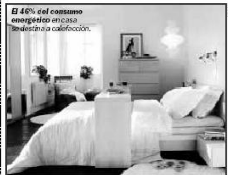
El 46% del consumo energético en casa se destina a calefacción.

100 euros menos al año. Un correcto aislamiento térmico, cerrar las persianas y cortinas por la noche para evitar perder calor, purgar el aire de los radiadores y no cubrirlos pueden permitir ahorrar hasta 100 euros anuales. (Metro)